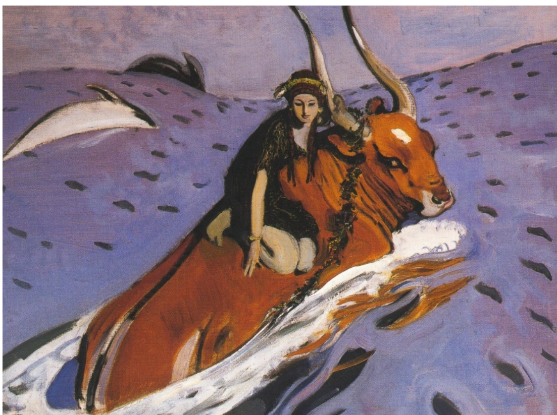
Europe et le taureau , Valentin Serov (Russie, 1910)

https://www.youtube.com/watch?v=awgADXlrpX8